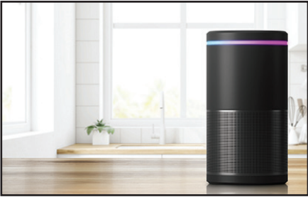
Smart speaker in a house.