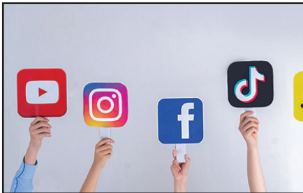
Logos for social media sites: YouTube, Instagram, Facebook, TikTok and Snapchat.