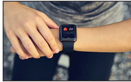
Someone doing sport and checking their smart watch.