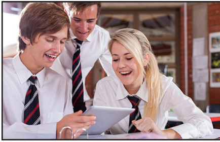
Students in school using a tablet.