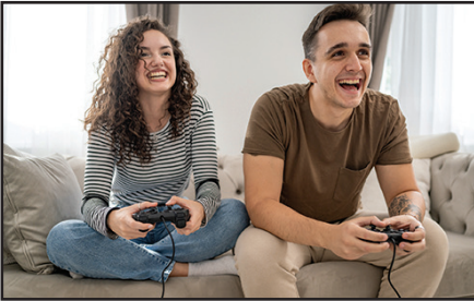
Boy and girl playing video games.