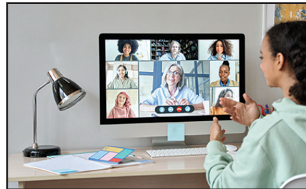
Girl sitting at a computer talking to family online.