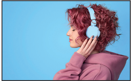
Girl wearing headphones listening to music.