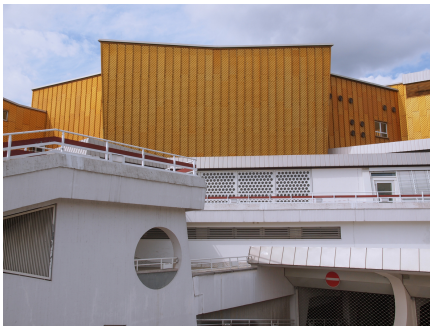
Die Philharmonie in Berlin – ein weltberühmter Konzertsaal

Jeden Dienstag um 13 Uhr im Foyer: kostenlose informelle Lunch-Konzerte