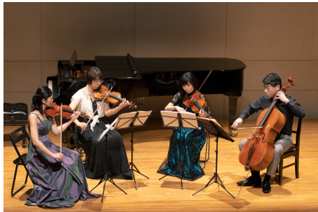
40-50 Minuten Kammermusik

Jeden Dienstag um 13 Uhr im Foyer: kostenlose informelle Lunch-Konzerte