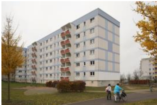
Ein Flüchtlingsheim in Bayern