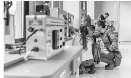
ein interaktives Erlebnis im ,Computerspielemuseum‘