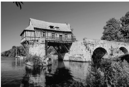
mittelalterliche Dorfanlage im Museumsdorf Düppel