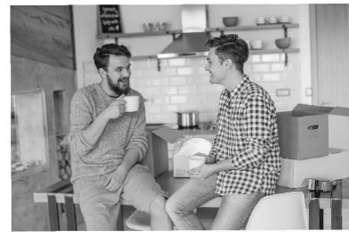
Singles ohne Liebesbeziehung