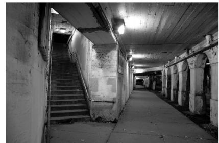
,Berliner-Unterwelten‘: Bunker, Tunnels und Abwassersystem