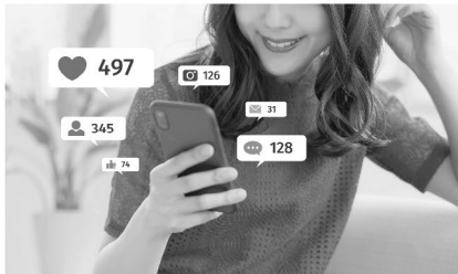
soziale Medien: die am häufigsten benutzten Apps