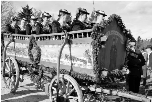
historische ‚Truhnenwagen‘: Teilnehmer in alter bayrischer Tracht

„Ein alter christlicher Brauch in unserer modernen Zeit – das soll noch lange so bleiben.“