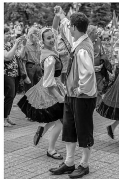
Volkstanz in traditioneller Schweizer Tracht