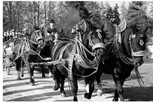
der bekannteste Leonhardi-Ritt in Bad Tölz: über 80 geschmückte Pferdewagen