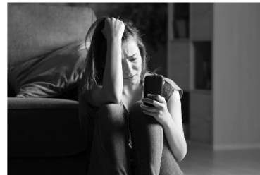
immer mehr Depressionen wegen Handysucht

„Durch Apps, Computerspiele und YouTube-Videos stehen Jugendliche unter digitalem Stress.“