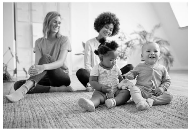
alleinerziehende Mütter, die zusammen leben