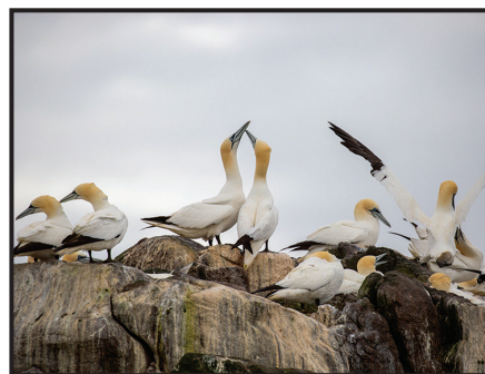
Huganod Ynys Gwales

Mewn llenyddiaeth Gymraeg mae Ynys Gwales yn fwy adnabyddus fel ynys arallfydol. Yn chwedl Branwen ferch Llŷr, mae'r saith gŵr a ddihangodd o Iwerddon yn treulio 80 mlynedd ar yr ynys yng nghwmni pen Bendigeidfran, yn gwledda ac yn mwynhau heb brofi gofid na galar.