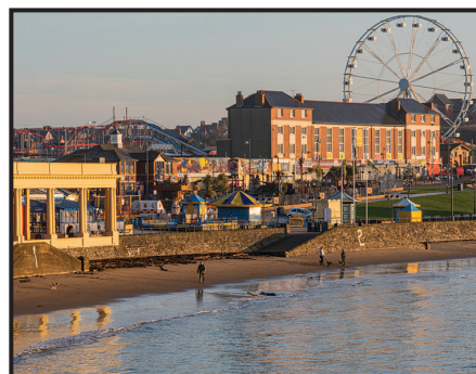
Traeth Ynys y Barri

Mae Parc Pleser Ynys y Barri yn berffaith ar gyfer pobl ifanc ac oedolion sy'n hoffi antur a chyffro. Bydd yn sicr o godi curiad eich calon. Mae reidiau ffair o bob math yma, gan gynnwys rollercoaster, reid ddŵr, dodgems a waltzer. Mae digon i ddiddanu'r plant llai hefyd gyda thrampolinau, cychod pedal ac atyniadau ffair traddodiadol.